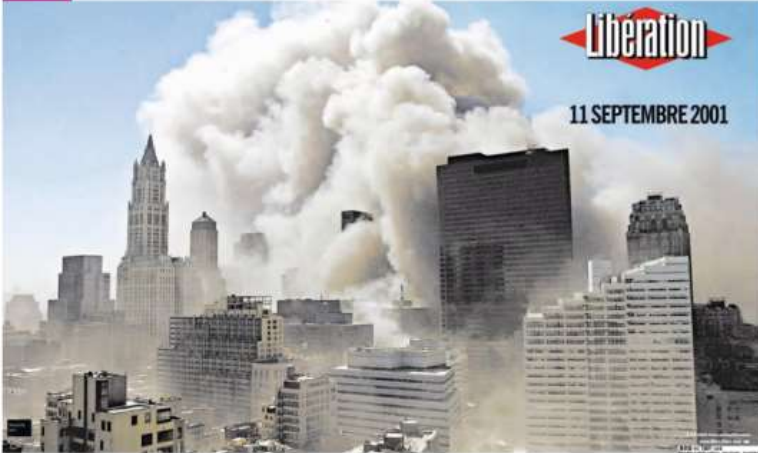
Une de Libération, 12 septembre 2001.

Au matin du 11 septembre, quatre avions américains sont détournés par des commandos suicidés. New York, 8h46 – Un premier avion percute la tour Nord du World Trade Center, centre des affaires le plus important de New York. 9h03 – Un deuxième avion s'écrase sur la tour Sud. Les deux tours, hautes de 110 étages, s'effondrent peu après l'impact. Arlington, près de Washington, 9h37 – Le vol 77 s'écrase sur le Pentagone, quartier général du département de la Défense américaine. Pennsylvanie, 10h03 – Le vol 93 s'écrase au sud-est de Pittsburgh.