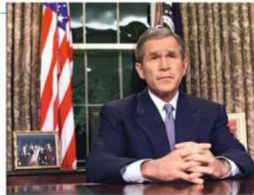
Discours télévisé du président George W. Bush, 12 septembre 2001.

Les attaques meurtrières et délibérées qui ont eu lieu hier contre notre pays étaient plus que des actes terroristes. Elles étaient des actes de guerre. Ces actes nécessitent l'unité de notre pays et son inébranlable détermination. La liberté et la démocratie sont menacées. Le peuple américain doit savoir que nous faisons face à un ennemi différent, tel que nous n'en avons jamais eu. Cet ennemi se cache dans l'ombre et n'a pas d'intérêt pour la vie humaine. C'est un ennemi qui s'attaque à des innocents puis qui se met à l'abri, mais il ne sera pas capable de s'abriter pour toujours. C'est un ennemi qui pense que ses bases sont sûres, mais elles ne seront pas sûres pour toujours. C'est un ennemi qui n'a pas seulement attaqué notre peuple mais aussi tous les peuples attachés à la liberté partout dans le monde. Les États-Unis utiliseront tous les moyens pour vaincre cet ennemi. Nous rassemblerons le monde [...] et nous gagnerons. [...] Les nations éprises de liberté sont à nos côtés. Ce sera un combat exceptionnel du Bien contre le Mal et le Bien l'emportera.