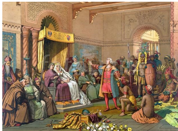
Retour de C. Colomb à la cour d'Espagne, 1493, XIXe s. Library of congress, Washington

En vous aidant des différents documents ci-dessus, quelles sont les conséquences de la découverte de Christophe Colomb ?